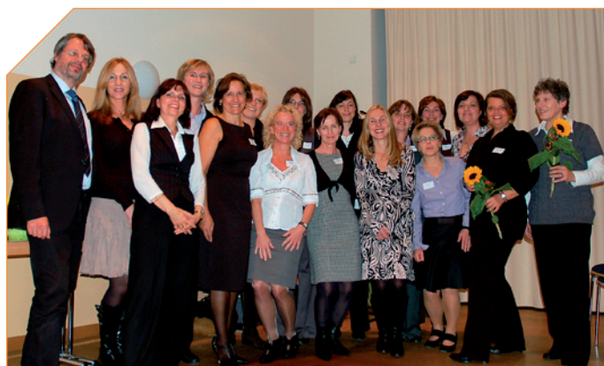
Absolventinnen des Seminars „Projekt- und Teamassistenten“

Hier setzt das TZG über das Tochterunternehmen Beschäftigungsförderungsgesellschaft mbH Rhein-Kreis Neuss (bfg) mit bedarfs- und zielgruppengerechten Integrationsprogrammen an.