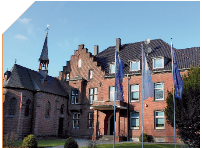
Technologiezentrum Glehn GmbH (TZG)

>> Passgenaue und auf die Arbeitsmarkterfordernisse ausgerichtete Seminare für von Arbeitslosigkeit betroffene Menschen erweitern das Bildungsangebot. Die Absolventen der Seminare Projekt- und Teamassistenten, Büroassistenten, Hauswirtschaft/Pflege und Betreuungsfachkraft für Demenzzranke erreichen kontinuierlich Einstellungsquoten von über 60%.