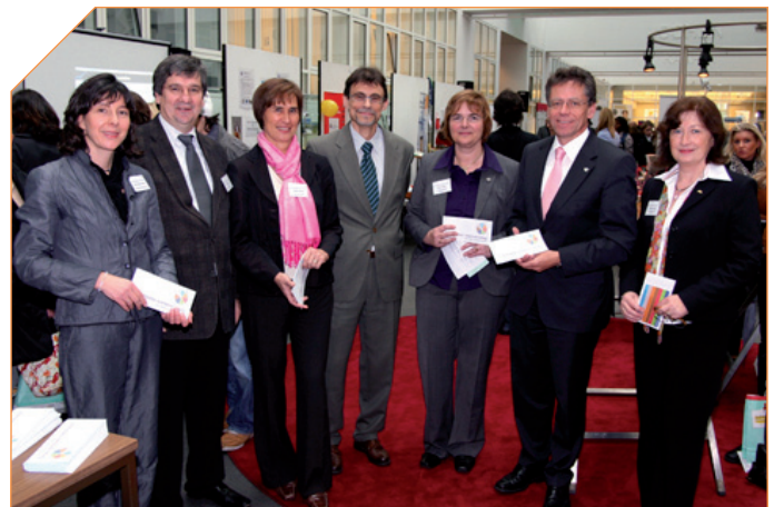
Infotag Wiedereinstieg Rhein-Kreis Neuss am 13.11.2009

Der Infotag Wiedereinstieg im Kreishaus Neuss im November 2009 bot mit Vorträgen, Workshops und Informationsständen ein umfassendes Informationsangebot, welches von über 500 Besucherinnen genutzt wurde.